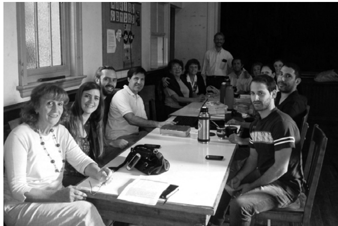
Estudio bíblico para adultos