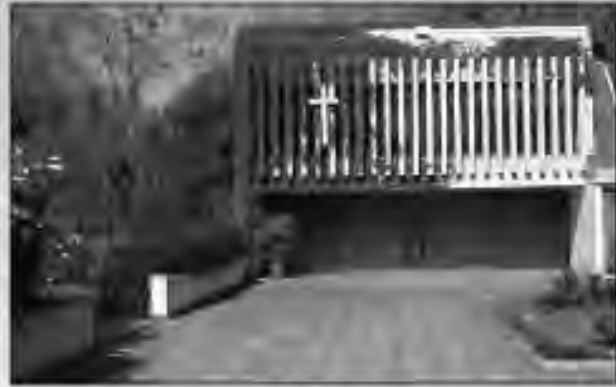
Capilla Pablo Nogués