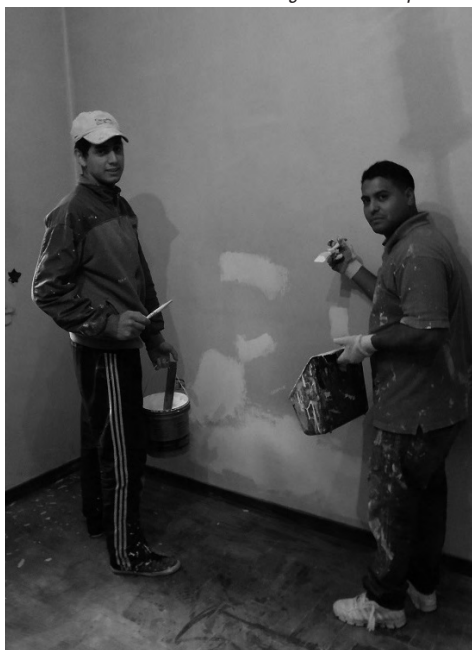
Arreglando la casa pastoral

la esperanza de poder escucharlos muchas veces más.